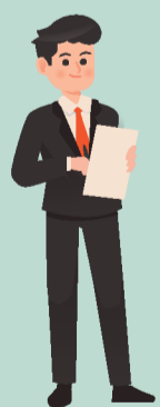
Голови відповідної виборчої комісії